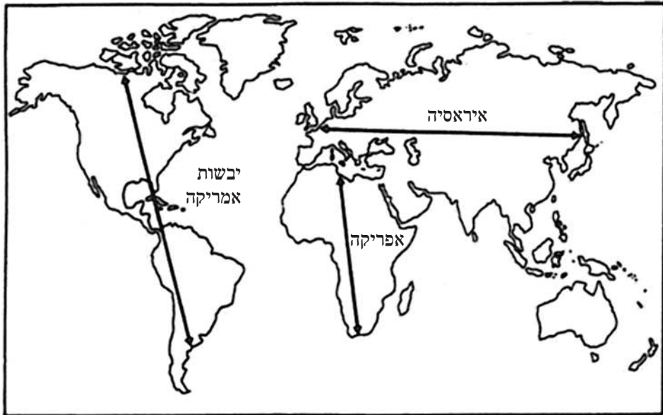
איור 1. צירי האורך והרוחב של היבשות (דיימונד 2002, 139)

רובים, חיידקים ופלדה (2002), מתבונן במפת העולם ומציע הבחנה מפתיעה: "אם תשוו את הצורות והכיוונים של היבשות במפת העולם המוצגת באיור תעמדו מיד על הברזל ברור. שטח יבשות אמריקה בכיוון צפון-דרום (14,400 ק"מ) גדול הרבה יותר משטחן בכיוון מזרח-מערב [כך בתרגום]: רק 4,800 ק"מ בקטע הרחב ביותר, שהולך וצר עד 65 ק"מ בלבד במצרי פנמה" (שם, 138). אך דיימונד מגיע לתובנה מפתיעה עוד יותר: לדידו, הואיל ותנאים אקלימיים ועונתיים משתנים מאוד בין קווי הרוחב, צמחים ובעלי חיים עשויים להתפשט ביתר קלות לרוחב (כלומר מזרחית ומערבית) מאשר לאורך (כלומר צפונית ודרומית). דוגמה לכך היא יער העד סביב נהר האמזונס, החוצה את דרום אמריקה לרוחבה. מכאן גוזר דיימונד שגם הציוויליזציות נוטות להתפתח לרוחב יותר מלאורך. מסקנתו היא כי לעומת הציר הקונטיננטלי האורכי באפריקה ובאמריקות, הציר הקונטיננטלי הרוחבי הארוך, המציג את אירו-אסיה כיבשת אחת גדולה, הוא הגורם להתפתחות המהירה יותר בחלקי עולם אלו. צמיחה זו לרוחב הואצה עם התפתחות כלי השיט והתעופה, והתפשטה לצפון ארצות הברית ולקנדה – ובמידה מועטה יותר לדרום ארצות הברית, למרכז אמריקה ולאמריקה הדרומית. הנה איורו של דיימונד: