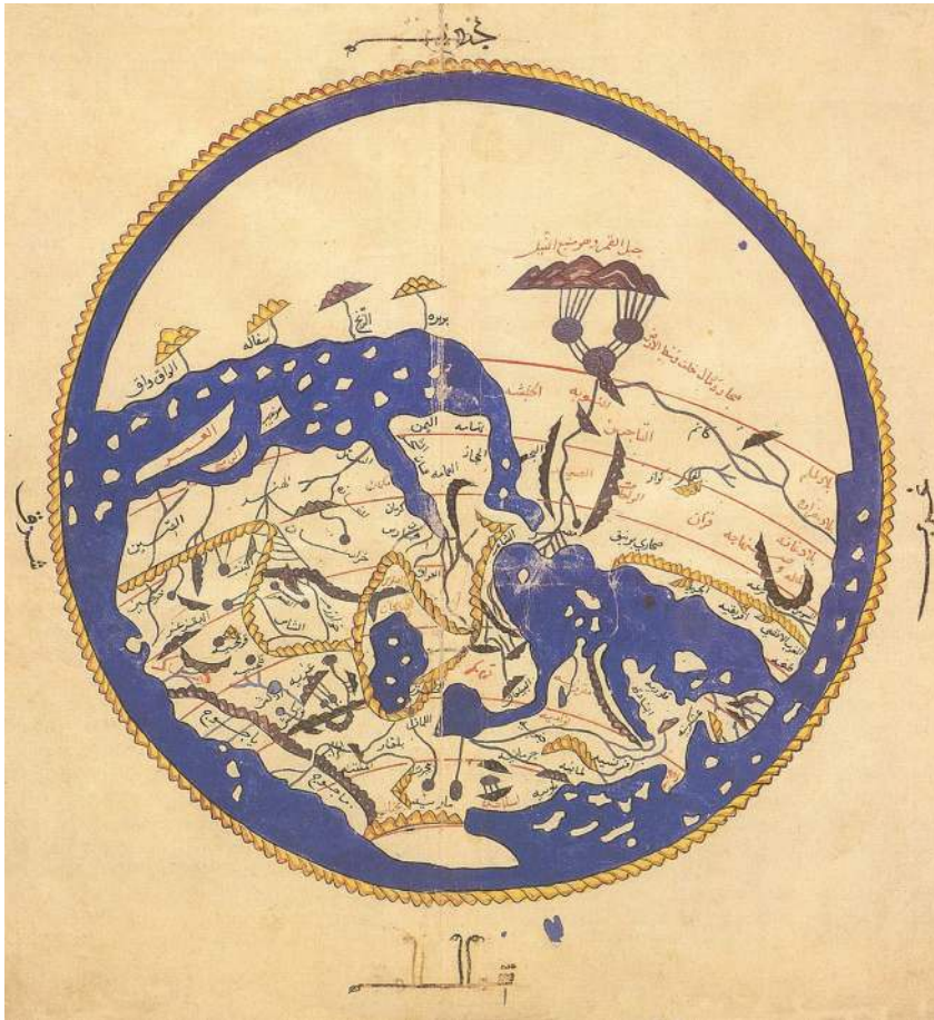
איור 2. מפת אל־אדריסי (Ibn Fadlan 2012)

על פי המפה של אל־אדריסי והסברו של אבן ח'לדון, האזור שכלל את מכה ואלמדינה, את א־שאם (ירדן, ישראל, לבנון וסוריה), את עריה הגדולות של עיראק ואת ערי צפון אפריקה שלאורך המגרב – הוא האזור הטוב ביותר על פני האדמה, שבו זוכים בשפע אלוהי מוגבר המאפשר לאדם להתנבא, לזכות בהתגלות ולהשתמש בשכלו בעילות רבה. השפע הזה הוא מנת חלקו של כל אדם שחי באזור זה, בלי קשר למוצאו הרחוק או לצבע עורו. כך יכלו המלומדים הערבים להסביר לעצמם כיצד בני דתות ולאומים שונים, הפועלים לצידם במרכזי הידע והמסחר, מגיעים להישגים נכבדים; כך הם גם יכלו לספק הסבר "מדעי" לעובדה שהדתות המונותאיסטיות התפתחו באזור זה, שהיה בעיניהם מרכז העולם – בין מכה, אלמדינה, ירושלים, בית לחם ונצרת; וכך גם הובן שגשוגן הרוחני והתרבותי של הערים בגדאד, בצרה, דמשק, חלב, קהיר, אלכסנדריה, קירואן ופאס.