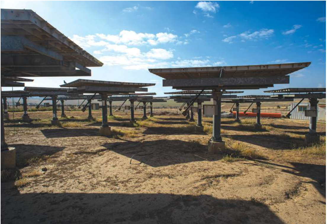
ואדי עתיר, פרויקט חקלאי בדואי בנגב, צילום: יובל חן