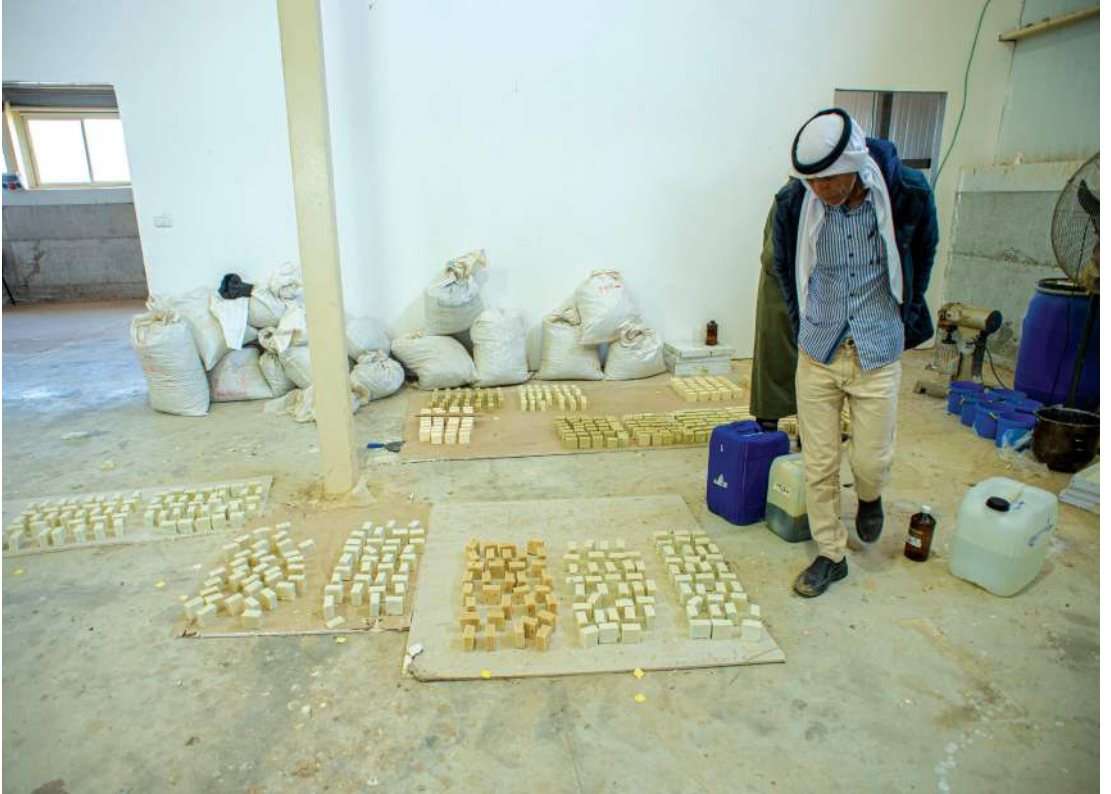
עלי אלהואשלה, ואדי עתיר, פרויקט חקלאי בדואי בנגב, צילום: יובל חן