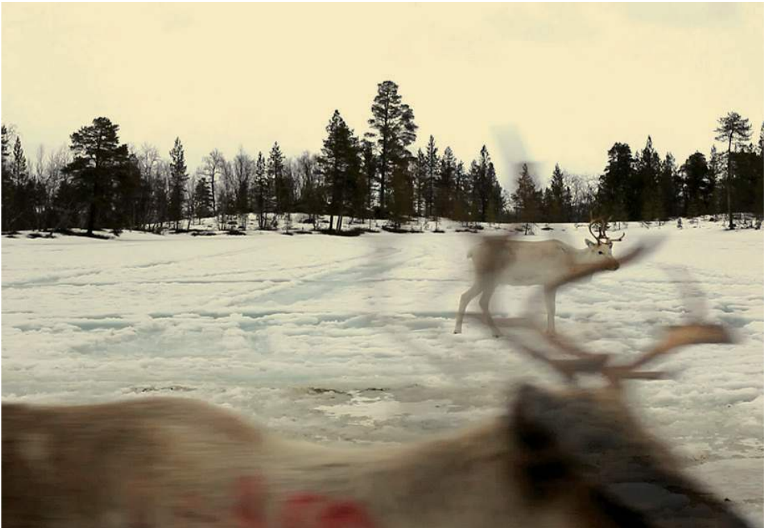
הקולקטיב המינורלי החדש, סטילס מתוך Hollow Earth , 2013, וידיאו