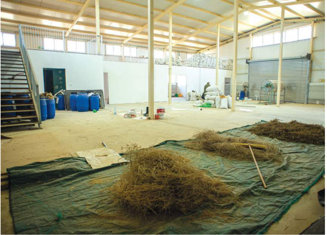
ואדי עתיר, פרויקט חקלאי בדואי בנגב