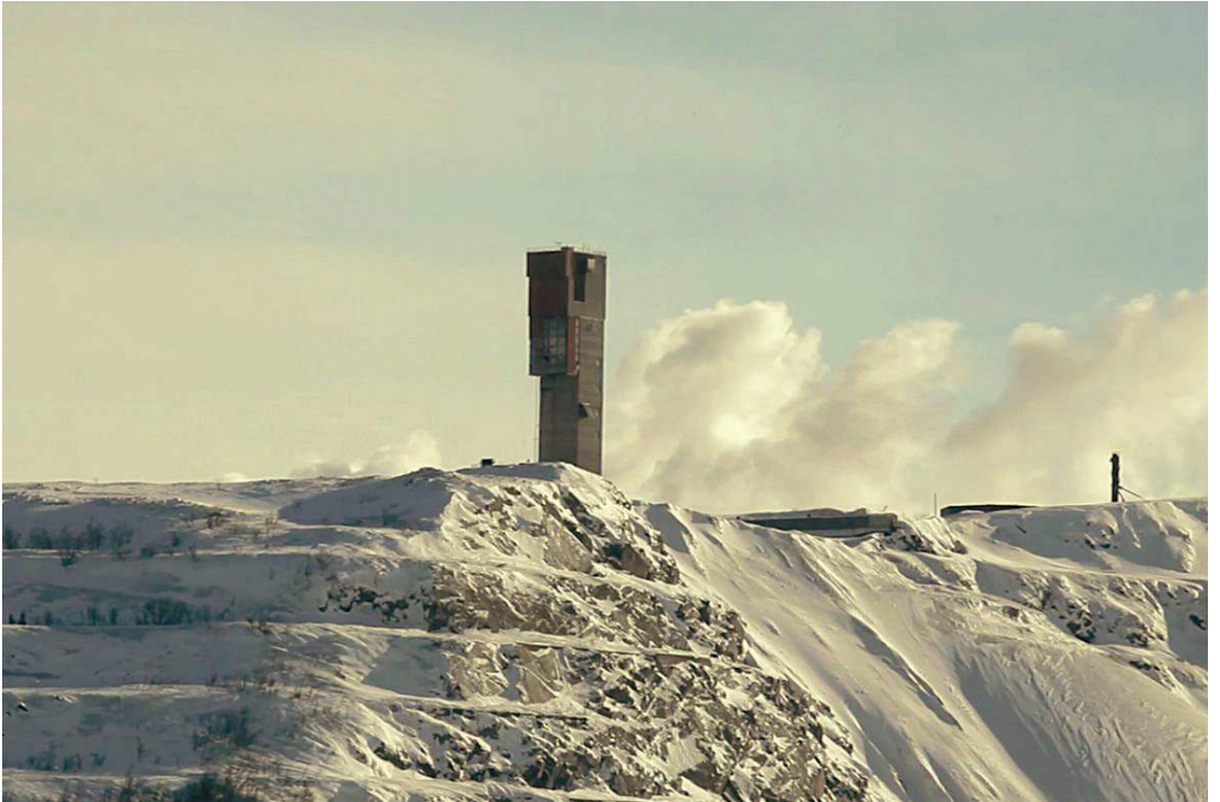
הקולקטיב המינרלי החדש, סטילס מתוך Hollow Earth , 2013, וידיאו