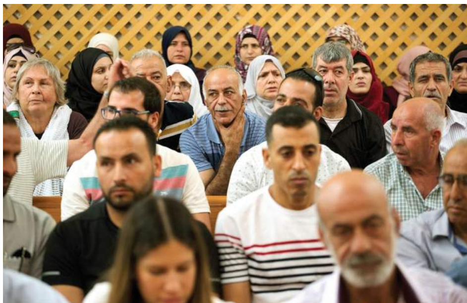
תצלום 3. תושבי בטן אל-הווא שבסילוואן, בדיון בג"ץ בעתירה שהגישו נגד עקירתם מבתיהם.