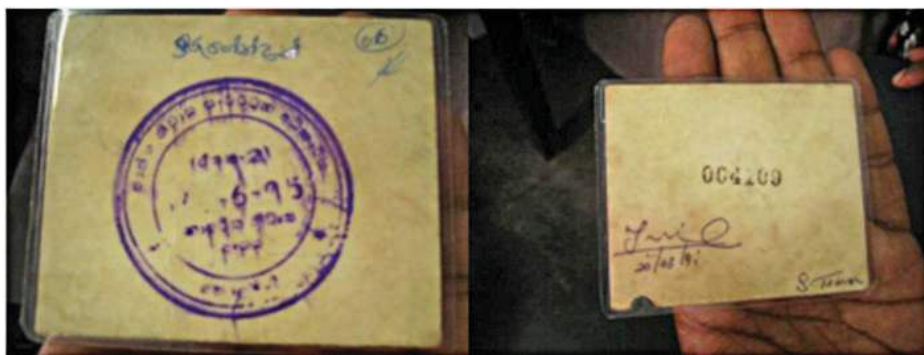
תצלום 1. תעודת תושב, קולומבו, סרילנקה.

תעודת התושב הנראית בתצלום 1 שייכת לתושב סמאג'י ואטה (Samagi Watta) – מתחם סלאמס בפאתיה המזרחיים של קולומבו, בירת סרילנקה. תושבי סמאג'י ואטה הם טמילים ומוסלמים ברובם, כלומר משתייכים לשני המיעוטים העיקריים של סרילנקה, בעיר שבה שולט הרוב הסינהלי. את התעודה הנפיקה בשנת 1989 עיריית קולומבו בעת מפקד אוכלוסין עירוני גדול שנערך באותה שנה. המחזיק בתעודה ובני משפחתו רשאים להתגורר זמנית באזור וליהנות מזכויות מוגבלות כמו שירותי חינוך לילדים, שירותי דואר, אספקת מים ושירותי ממשל. התעודה אינה מקנה זכויות השתתפות פוליטיות, כמו הזכות לבחור ולהיבחר בבחירות המקומיות (Avni and Yiftachel 2014).