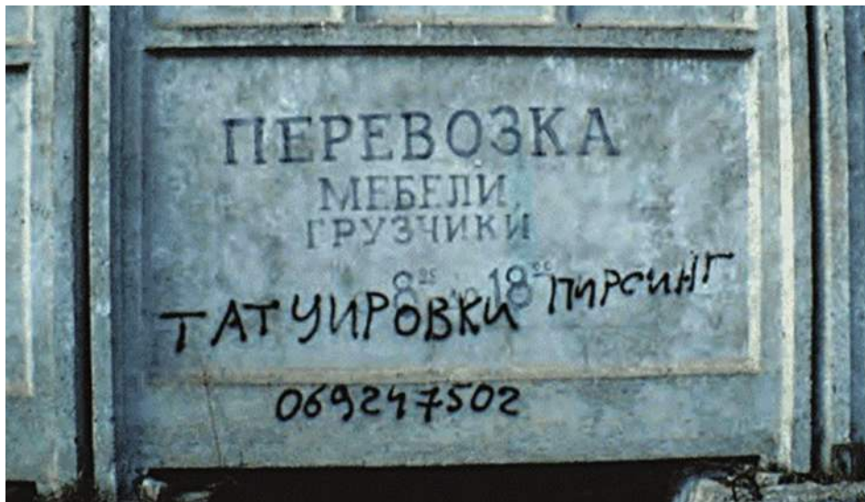
תצלום 2. פרסום בשפה הרוסית לחברת הובלה ומתחזי פרסום לפירסינג וקעקועים, טאלין, אסטוניה.