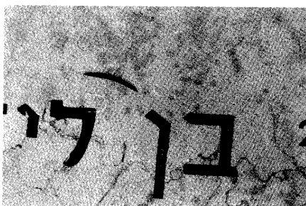
בן לי. צילום: יהודית מצקל, מתוך "נולד מת", 1999

הפרויקט "נולד מת" בוצע בבתי קברות לחיילי צה"ל. מצקל יצאה מן הבית, התרחקה מגוף האם והלכה למקום שבו מביאים את משרתי המדינה למנוחה אחרונה. נוכח הקברים, ללא כל עיבוד מאוחר, סגרה עם המצלמה על אותיות המצבה, כך שהטקסט הכתוב עליהן פורק והורכב מחדש. שפה