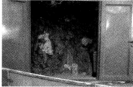
צילום: יהודית מצקל, מתוך "חצאית בדרך", ספטמבר 2000

תמונה 3. אגף המכנסיים ערימת מכנסיים ריקים. מדים ללא חיילים. בגדים שאנשים שהו בהם, והסתלקו מתוכם. אסתיקה מוכרת, אייקון שקוף. הרבה מאותו הדבר, ריק ממשמשויו. הטליתות, הנעליים, המשקפיים, המזוודות. לצלם מבפנים, את האין, את הלא-אישי, את ההצבר, את המועתק/מנותק מבעליו. לשמור על עין מנוכרת. להחזיר ציוד.