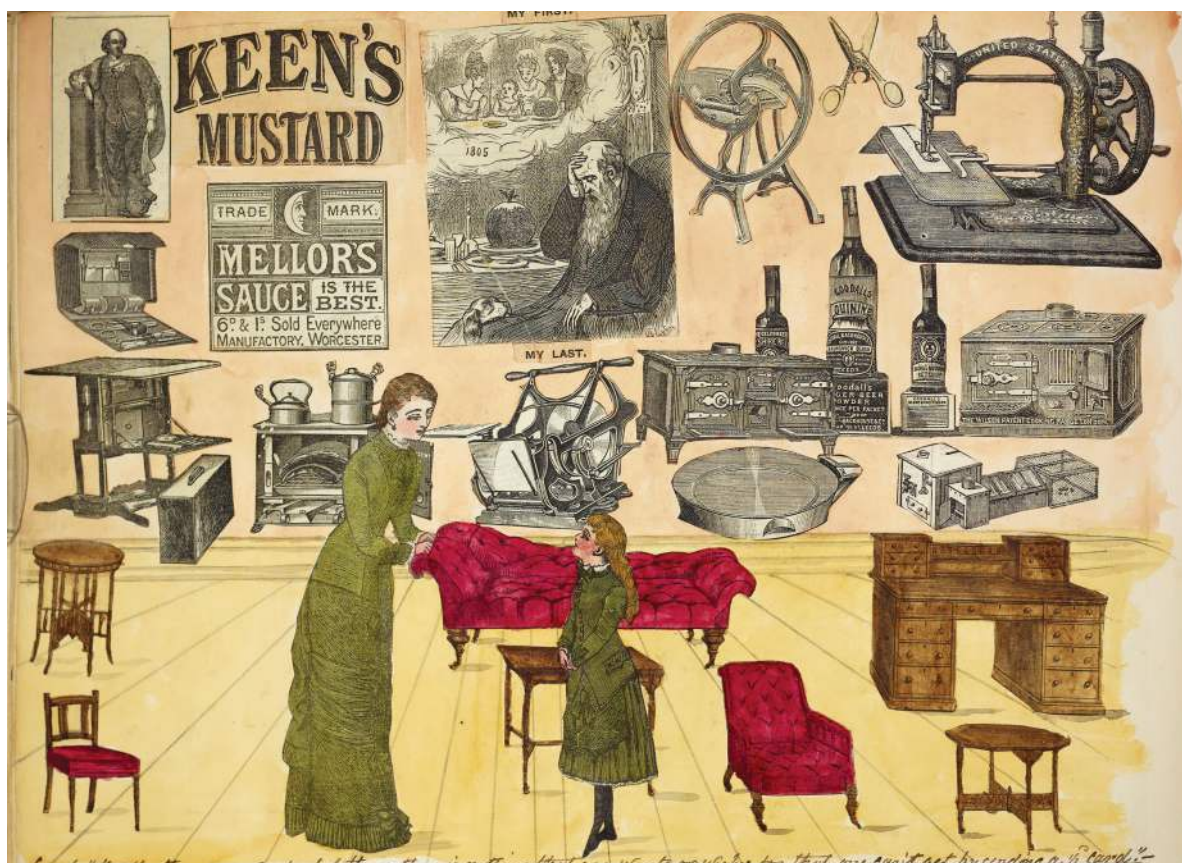
אלבום אנונימי. יצירת אלבומים מגזרי עיתונים ועלונים הייתה פעילות פנאי פופולרית, בפרט בקרב נשים.

לפיזיקה (או למטפיזיקה) של מרכז היקום ואף למסודות חברתיים ידועים: בתי העניים, הכלא, העירייה, הכנסייה, בית המשפט, המלוכה. אפשר לראות בפרסומת הטרמה לרעיונות של פולני, שיכתוב ארבעה עשורים לאחר מכן על חשיבות השבת, המקדש, הכפר, הגילדה והכנסייה.